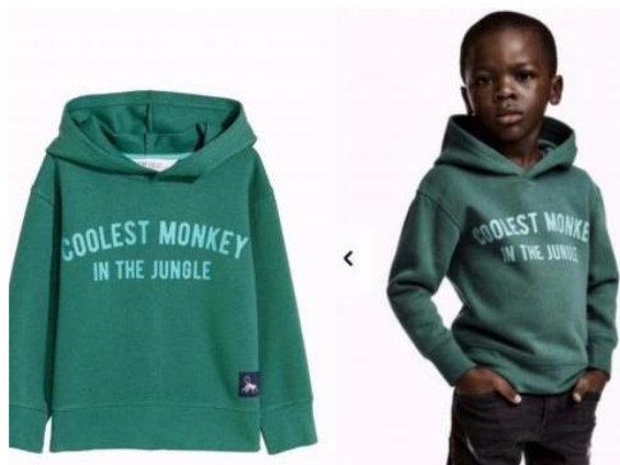
Imagen 1: colección de invierno de niño de H&M

Como hemos expresado en el punto anterior H&M en una de sus colecciones de ropa de niño del invierno pasado, utilizó la frase "The coolest monkey in the jungle" lo que se traduce como "el mono más guay de la jungla" utilizando para ello un niño africano. Ante este suceso, muchas personas se sintieron ofendidas señalando a la empresa como racista y deshumanizadora de personas. Resulta difícil de entender como una empresa como H&M tan conocida y grande puede cometer tal error.